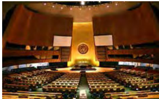
Sala Obrad Zgromadzenia Ogólnego ONZ (Nowy Jork)

Poradnik prezentuje prawny kontekst korupcji i jej konsekwencje. Opisuje przykłady nieprawidłowości, które mogą się pojawić w biznesie i na styku sektora publicznego z prywatnym. Przedstawia algorytmy zachowania w sytuacjach korupcyjnych. Biuro zwraca uwagę czytelnika na politykę antykorupcyjną przedsiębiorstwa, środki ograniczające korupcję w biznesie oraz prawne i instytucjonalne możliwości ścigania korupcji.