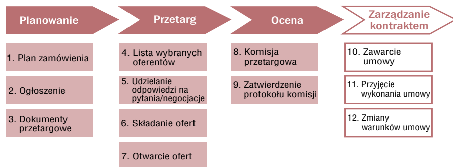
Ilustracja 1: Etapy typowego cyklu zamówienia publicznego z możliwością wystąpienia korupcji

Ciężko jest udowodnić, że ktoś zapłacił łapówkę, jednak istnieją pewne symptomy, które mogą wskazywać na zachowania korupcyjne. Skargi od niezadowolonych [przegraných] oferentów na nierówne traktowanie i ślad na papierze pozostawiony przez urzędnika kierującego projekt z założeniami przetargu do faworyzowanego oferenta często stają się początkiem afery korupcyjnej. Kolejna część podręcznika przedstawia oznaki i sygnały ostrzegawcze, na które funkcjonariusze publiczni mogą zwrócić uwagę, nadzorując udzielanie zamówienia publicznego. Pojawienie się takich sygnałów ostrzegawczych powinno ich zaalarmować, że przetarg może być ustawiony. Korupcja i ustawianie przetargów mogą pojawić się na każdym etapie zamówienia. Budowa – często zawiłych – mechanizmów korupcyjnych zaczyna się zazwyczaj na etapie planowania zamówienia publicznego, kiedy podejmowane są decyzje kluczowe co do organizacji procedury oraz kolejności dalszych działań, a kontrakt jest w fazie projektu. Urzędnicy mają pewną dowolność przy tworzeniu specyfikacji i kryteriów kwalifikacji wykonawców, co stwarza możliwość formułowania warunków przetargu pod wykonawców faworyzowanych przez zamawiającego. Ilustracja 1 przedstawia procedurę zamówienia publicznego podzieloną na cztery etapy.